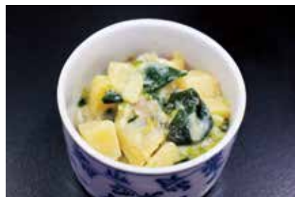
96995 あさり旬菜酢味噌和え

季節感のある食材に酢味噌の風味が良く合います。 入数・規格: 1kgX12BL入 用途: 小鉢 原材料: 菜の花、筍、あさり、酢味噌、他 味付・保存: 酢味噌風味・冷凍