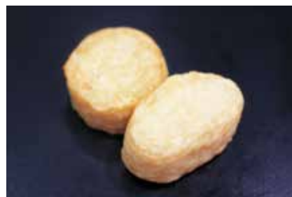
97002 桜海老と筍の豆腐寄せ

生地のおふふとした食感と季節の桜海老と筍の風味をお楽しみ下さい。 入数・規格: 50個X6袋入X2合・L約4cmW約3.5cmH1.5cm 用途: 煮物・揚げ物 原材料: 豆腐、魚肉、筍、玉ねぎ、桜海老、味噌、他 味付・保存: 薄味・冷凍