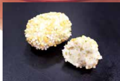
70040 玄米揚げ(ふきのとう)

香ばしい衣とふきのとうの風味が絶品です。 入数・規格: 32個X16BL入・φ約2cmL約3.5cmH約2.5cm 用途: 揚げ物 原材料: 里芋、ふきのとう、筍、玄米、他 味付・保存: 薄味・冷凍