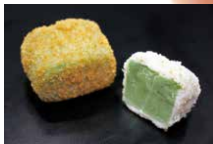
97013 揚げ蓬豆腐米パン粉

サクサクした衣ととろけるような蓬豆腐が絶妙です。 入数・規格: 15個X20BL入・L約4cmW約3cmH約3cm 用途: 揚げ物 原材料: 蓬豆腐、こしひかり米パン粉、甘藷澱粉、他 味付・保存: 薄味・冷凍